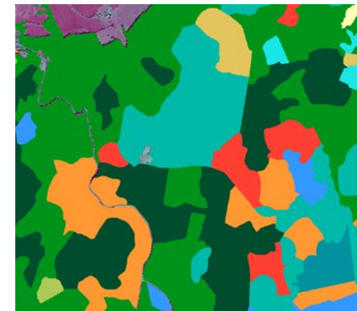
Type de formation végétale (BD ORTHO®)