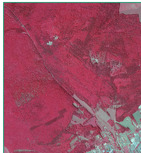
Orthophotoplan en Infrarouge Couleur (BD ORTHO®)