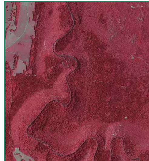
Orthophotoplan en Infrarouge Couleur (BD ORTHO®)