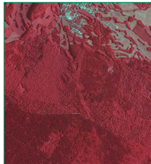
Orthophotoplan en Infrarouge Couleur (BD ORTHO®)